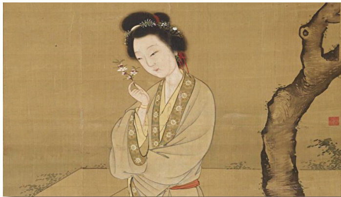
圖為明張紀繪《人面桃花圖》局部。（公有領域）

犹记得去年的一个春日，桃花开得灼灼，他邂逅了树下的陌生少女。女子巧笑倩兮，花面相映，而他凝眸端视，心驰神摇。不知是桃花映红了美人的面容，还是姣好的容颜照亮了繁盛的花树？