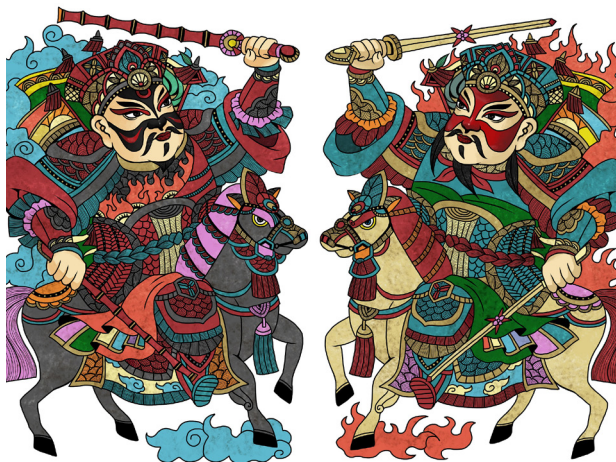
古代中國人過年畫桃符驅鬼避邪，是為門神畫的源頭。

在乾隆初年，规定正月十五前后五天，在西苑西南门内的高山长水楼看烟火。那楼有五根大柱子，楼前有一块几顷大的草坪。那楼采光、通风都很好，特别干爽。站在楼上远眺西山，好像苑墙间生出了一个发髻，灰濛濛地像一幅水墨画。这几天一到申时（下午三点到五点），内务府的官员就在楼门外设好了御