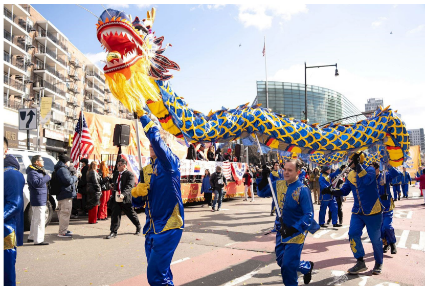
乙巳年大年初四，美国纽约法拉盛举行一年一度的华人新年大游行。

在中国传统的节日中，最热闹、最受人们重视的是“过年”。过年是指在新的一年里庆祝、作乐的活动，实际生活中还往前延伸到过年的准备。中国传统的黄历正月初一，又称中国新年；当今人们过中国新年时，仍要比公历元旦隆重得多。过年的准备活动通常自黄历腊月廿三送灶神就开始了，过年的庆祝活动则一直延续到正月十五元宵节，其中除夕夜和正月初一是最为重要的日子。