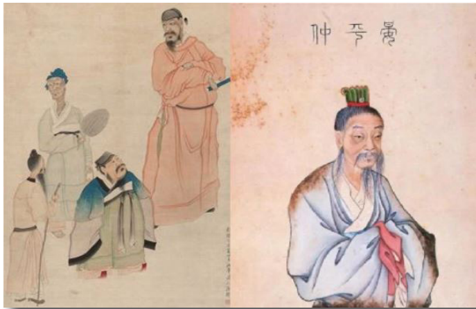
兩幅晏子圖像：左圖為清代羅聘《晏子使楚圖》，右圖為清乾隆年間《歷代名臣像解》之晏平仲（晏子）像。

在中华文化的川流中，“虚室生白”是中华文化的思想观之一，它出现在道家思想中，也被历代不同的人事物取用，历来受到重视未有间断，成了一种处世智慧。“虚室生白”出自何处？我们的先人怎样体现这种精神智慧？