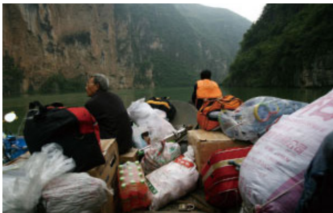
为兴建三峡大坝，无数居民家园被毁，面临离乡背井居无定所的困境。

2020年6月27日，湖北宜昌市遭遇洪水袭击，全城一片汪洋大海。现场网络视频显示城区水位竟然淹没过轿车车顶；一辆正在前行的电动车主，被洪水冲击后，手抓住了街道的铁栏杆，胯下电动车随着湍急的水流瞬间甩出去十多米远。