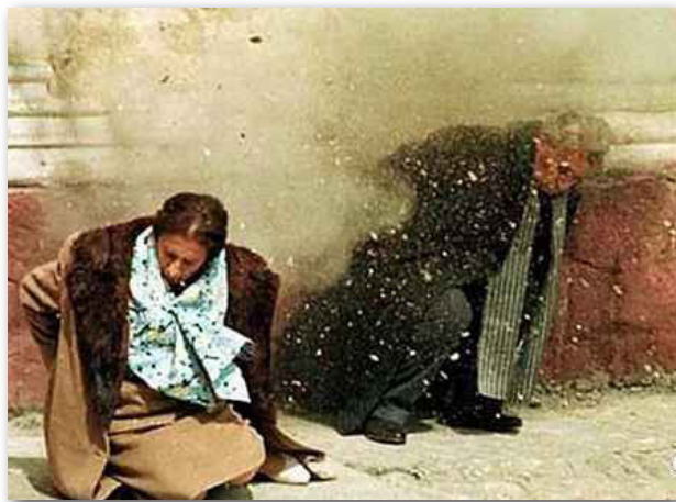
齐奥塞斯库夫妇遭乱枪扫射时的场景

1989年12月21日，齐奥塞斯库在首都布加勒斯特举行群众集会，演讲时突然人群中传出“打倒齐奥塞斯库”的声音，人群中“打倒杀人犯”的口号声此起彼伏。头戴钢盔的武装警察将四周的街道包围，军官