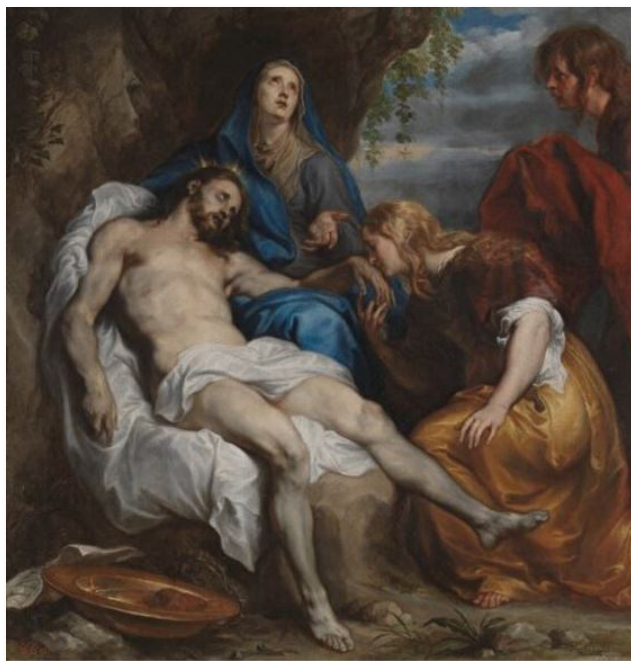
安东尼·范·戴克（Anthony van Dyck）的作品《哀悼基督图》（Pietà），约1629年。

范戴克利用巴洛克艺术中典型的构图方式，增强了这幅作品的戏剧效果。他没有采用文艺复兴艺术家常见的静态、平静的三角构图，却倾向使用更多的曲线、动态和情感，试图更加完整地传达出这场事件的戏剧性。◇（摘自英文《大纪元时报》The Pietà: An Image of Compassion）