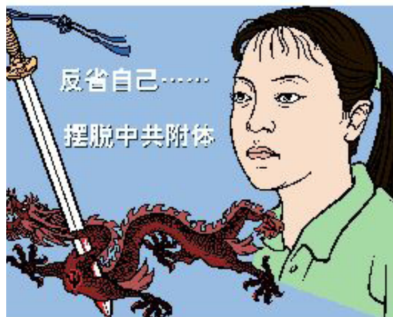
反省自己摆脱中共附体

唯有放弃所有幻想，彻底反省自己，而坚决不被仇恨和贪婪欲望所左右，才有可能彻底摆脱这一长达50多年的附体梦魇，以自由民族之身，重建以尊重人性和具有普遍关爱为基础的中华文明。◇