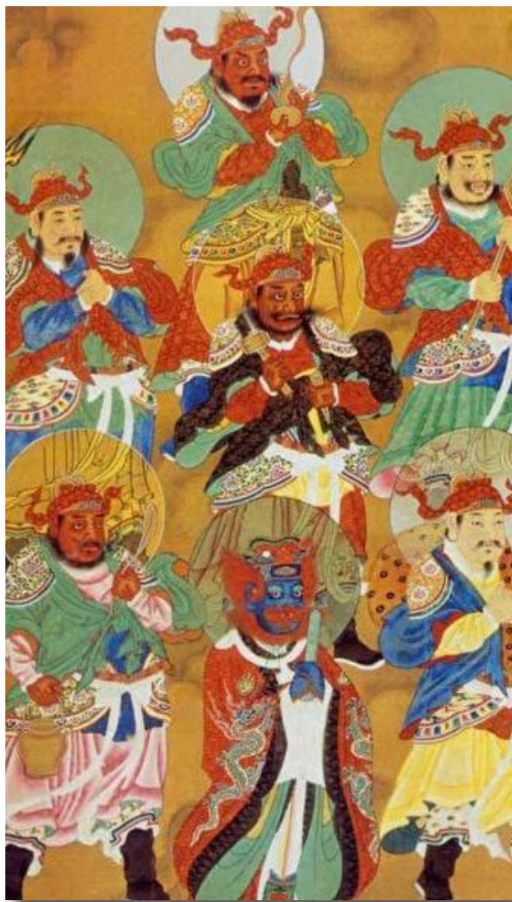
明代万历年间的五瘟神画像，局部。

在中华传统文化中，有着对于各种各样的神明，如河神、山神、雷神、土地神等等的敬仰。神明们掌管天地间万事万物。他们的故事，不仅世代在民间流传，而且许多有缘之人都曾经在梦中或者一些特定的情况下见识了神灵的存在。