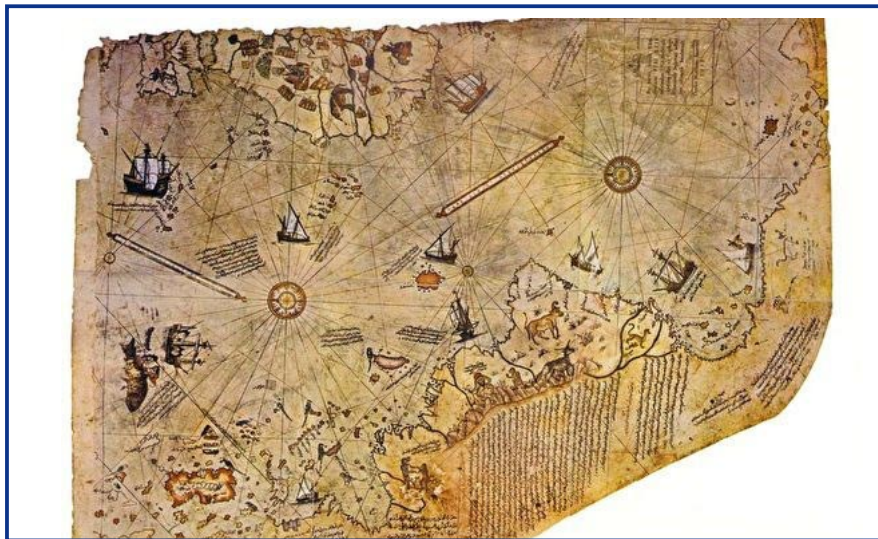
皮瑞·雷斯地图（1513年绘制）（维基百科）