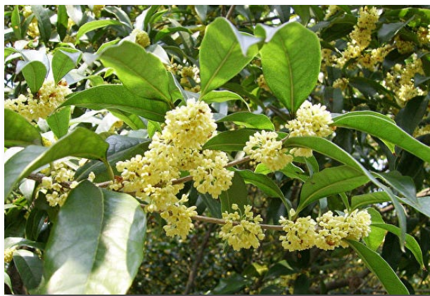
杭州的桂花

又是不知不觉被潇潇洒洒的雨露带到一个洗得几近透明的清秋，又是月上中天、桂子飘香的时候。桂花是我国传统名花之一，“暗淡轻黄体性柔，情疏迹远只香留。何须浅碧深红色，自是花中第一流。”