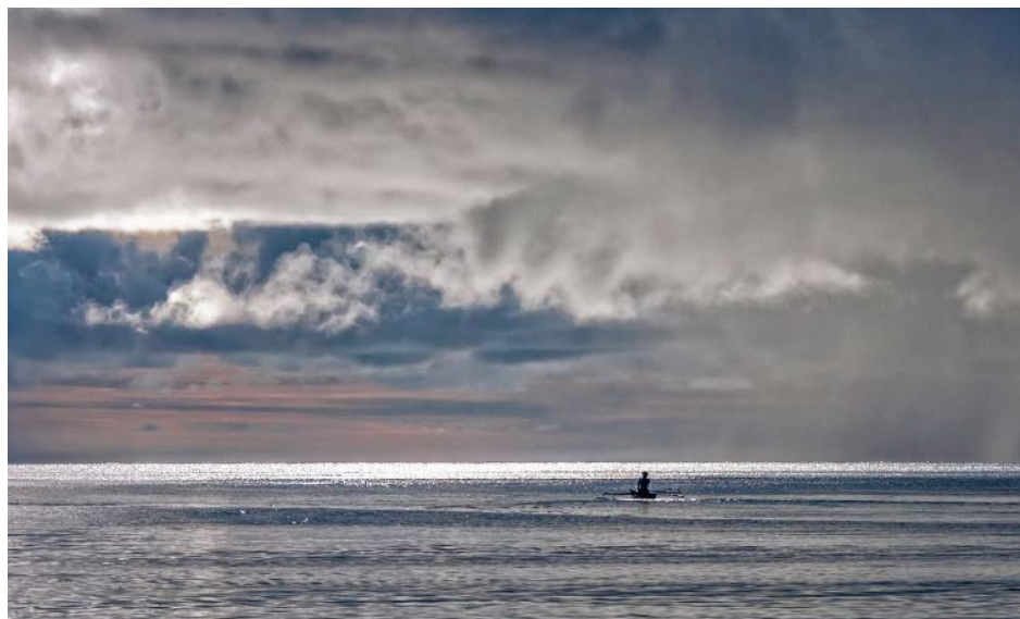
巫宁坤的坎坷磨难是民族悲剧的缩影。

2019年8月10日，旅美著名翻译家巫宁坤去世，享年99岁。这一消息登上国内网站头条，点击量达一千多万。有人说：他死在美国，却震动中国。