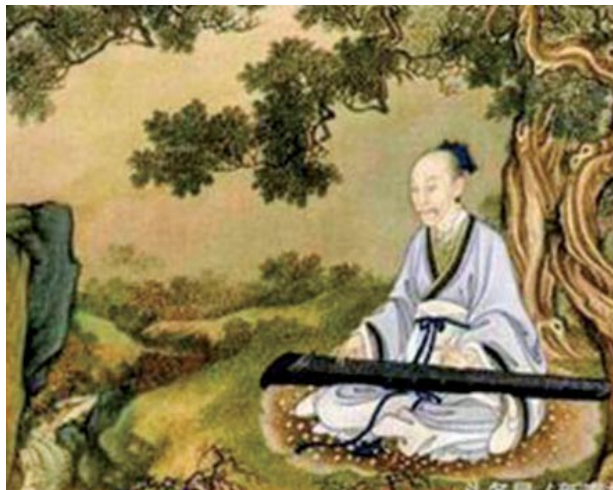
「樂由天作」。兩千五百多年前，晉國的師曠展現了出神入化的音樂技能。

中国人敬天信神、重德向善，这体现在古代社会生活的宏微万象中，涉及政治、农业、科技、建筑、医药、乐舞、诗歌、书画等各项活动。顺天道，应天时，合乎礼，守仁义，方得国泰民安。在不同领域出现的“仙”、“圣”名流，其在当世展现的超凡技艺，都与自身的高德紧密相连，起到了教化人心的作用。他们的神迹和神技，映衬中华五千年文明的辉煌，为神州增添异彩。◇