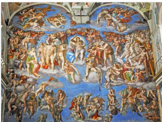
米开朗基罗制作的巨幅壁画《最后的审判》

1536年，在西斯廷教堂祭坛后面220平方米的大墙上，米开朗基罗（Michelangelo Buonarroti，1475年—1564年）用了近6年的时间，绘制了壁画《最后的审判》，将《圣经·启示录》的末日审判表现得淋漓尽致，惊心动魄。神高举右臂宣告审判开始，行善者升入天堂，作恶者打下地狱。