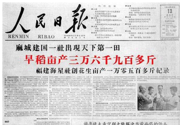
《人民日报》有关湖北麻城创出早稻亩产36,956斤记录的报导。

更苦不堪言的是，折腾农民大规模弃农炼钢，把铁犁、铁锅等砸了炼钢铁。青壮年都投入炼铁和修水库，耽误了农时，庄稼来不及播种或收割，大片田地荒芜。粮食大量减产，各省却“喜报频传”，陷入“亩产万斤”的吹牛狂欢。公共食堂把“无产阶级专政”贯彻到每一个人的肚子里，谁不听话就不给饭吃，“扣饭”是普遍现象。一些地区农民想开荒种地、在自家吃饭也不行，自留地收归集体，除了公共食堂以外，家里的烟囱不许冒烟。全国各地已经形成了一种消灭私有制、向共产主义进军的强大政治声势。