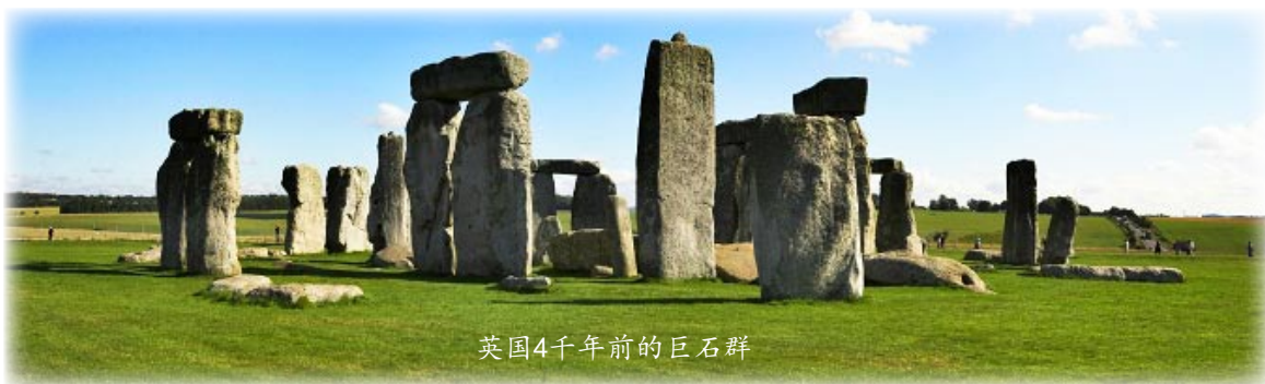
英国4千年前的巨石群