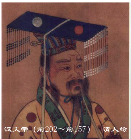
汉文帝（前202～前157） 清人绘