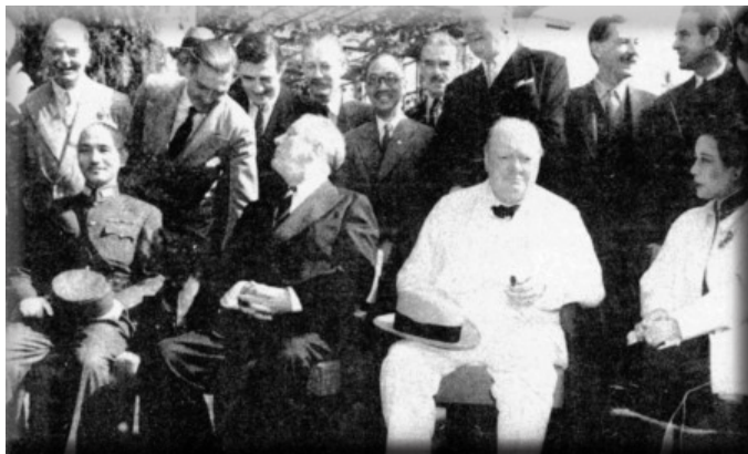
1943年，中美英三国领袖在埃及开罗举行峰会，前左侧是中国国民政府总统蒋介石，旁边就是美国总统罗斯福、英国首相丘吉尔、中国第一夫人宋美龄。

珍妮·狄克逊（Jeane Dixon，1904 - 1997年）是二十世纪很有人气的天才女预言家。她曾经预言了一些令人意外、震惊的二十世纪大事。她在1997年离世那年给乱世一个希望的预言：人类的希望在东方！东方将出生一个彻底改变世界的人，他传播神的智慧给人。她预言2020年世界将遭遇“善恶大决战”。