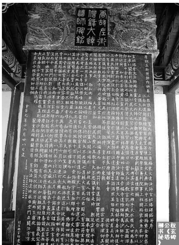
柳公权书法《大达法师玄秘塔碑》原物

柳公权擅写楷书，是“楷书四大家”之一。他的字，以骨力劲健见长，后世有“颜筋柳骨”之称。柳公权现存的书法有：《金刚经碑》、《大达法师玄秘塔碑》，内容多为赞誉和弘扬佛法。《大达法师玄秘塔碑》建立于唐会昌元年（公元841年），是柳公权晚年的成熟的书法作品。该碑由当时的宰相撰文，内容是一个叫“端甫”的和尚弘扬佛法、受到唐朝德宗皇帝、顺宗皇帝、宪宗皇帝礼遇、使“天子益知佛为大圣人”的故事。该碑，运笔健劲舒展，干净利落。体现了唐代上至皇帝、宰相、下至百姓普遍敬佛的风貌。