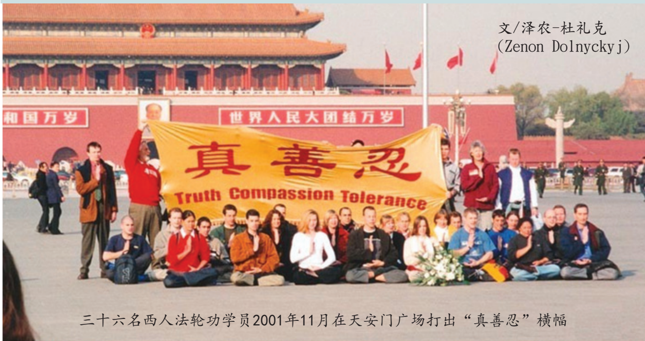
三十六名西人法轮功学员2001年11月在天安门广场打出“真善忍”横幅

法轮大法来自于你们中国那块土地和中华民族博大精深而又美好的文化。如果没有大法，我不会是今天这样一个按照“真、善、忍”去做的人。带着最深的敬意，我踏上了你们的国土，为了你们而支持真理。我希望我这一副外族的面孔和纯净的心能够唤起你们心中依然存在的善良。请不要追随江泽民和他的犯罪集团迫害法轮功，这对你们真的不好。