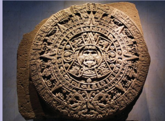
富丽堂皇的玛雅庙宇刻有玛雅历法的石碑