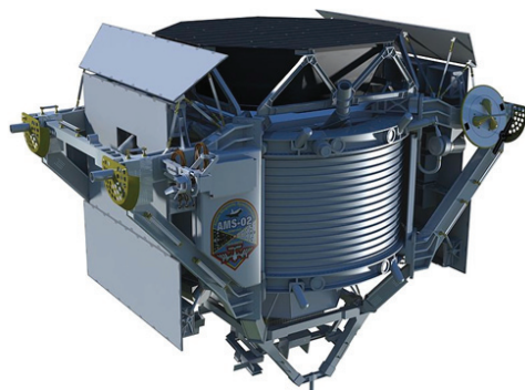
2011年5月16日由美国航空航天局奋进号航天飞机送入国际空间站的阿尔法磁谱仪二号

科学家早已从不同角度在进行研究、探讨，并认为是完全可能存在的另外空间。物理学家通过研究提出存在着与我们人类所存在的空间平行存在的“平行世界”[1]。科学家还提出了宇宙应是多维的，如10维或11维空间，甚至有人认为宇宙是无穷维空间[2]。1970年代提出的“超弦理论”则突破了爱因斯坦的四维时空观，从数学上论证宇宙应是大于四维的多维空间。