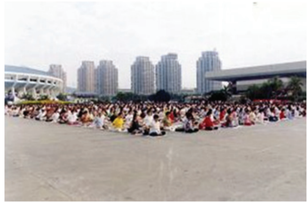
九九年“七·二零”前深圳法轮功学员炼功

国被迫害致死法轮功学员3425例，其中女性约占53%，50岁以上的老人有半数多，约占62%，还有几例十几岁的孩子，大多都遭受过酷刑迫害，有的是被短期酷刑虐杀，甚至是非非法抓捕当天就被活活打死，还有一些则是多次被非法抓捕多次遭受酷刑虐待，经受了漫长痛苦的煎熬而离世的。被非法判刑、非法劳教的人数超过10万人，数千人被强迫送入精神病院受到药物的摧残，大批法轮功学员被绑架到各地洗脑班被逼放弃信仰。众多法轮功学员被迫害的妻离子散、流离失所，无以计数的法轮功学员遭到骚扰、监控，亿万法轮功学员的家属、亲朋好友和同事受到不同程度的株连与洗脑。