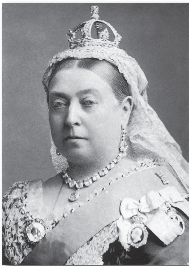
1882年的维多利亚女王

英国在位时间最长的君主——维多利亚女王诞生于1819年5月24日。1837年威廉四世逝世，维多利亚即位。当时的维多利亚仍是未脱稚气的18岁少女，朝中官员并不看好她，认为她在位的时间不会长久。