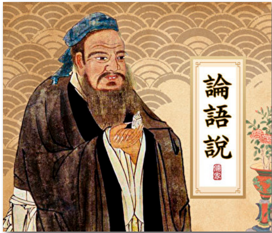
《论语说》（公有领域/大纪元制图）

子曰：“能以礼让为国乎？何有？不能以礼让为国，如礼何？”（《论语·里仁·十三》）