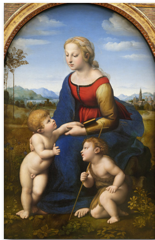
拉斐尔《圣母子与施洗约翰》，又称为《美丽的女园丁》（La Belle Jardinière）（公有领域）

（注2）十六世纪意大利的瓦萨利在其著作“艺术家列传”中使用了“rinascita”来描述乔托、米