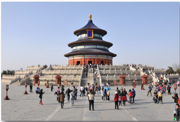
帝王在天坛祭天、祈谷、祈雨。

进入腊月，黄历新年的脚步声近了，但人们却感觉不到过年的气氛，很多人都说“现在年味越来越淡了。”似乎只剩下了吃年夜饭、放鞭炮烟花。连拜年都省了，群发短信就解决了。农村里还好些，有的城市鞭炮都禁放了。