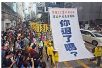
（2004年11月，大纪元系列社论《九评共产党》发表。自2004年12月3日至2022年1月25日，公开声明退党（/团/队）人数：390,556,743。）

观天下之势，兴亡谁人定，盛衰岂无凭。在没有共产党的日子里，必能还人间一股祥和气，使百姓真诚、善良、谦逊、忍让。让国家俯首农桑、百业兴旺。◇