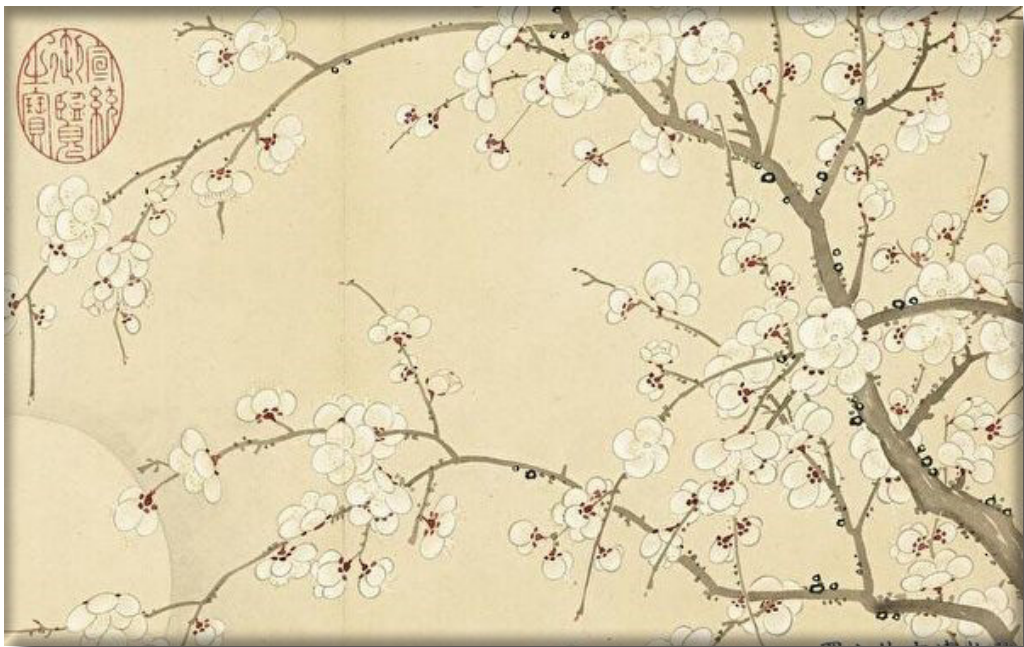
二十四番花信风，以梅花为首、楝花为尾。赏梅赏的是内蕴、是风骨，范成大的《霜天晓角》，亦写出了梅花独特的风韵。图为清 董诰绘《月映梅花》。

梅花长于冰雪林，如山中高士、月下美人，独立世间。它不同于牡丹的富艳、荷花的清纯、杏花的娇羞，以欺霜傲雪之姿、暗香疏影之美，成为文人气节和情怀的寄托。