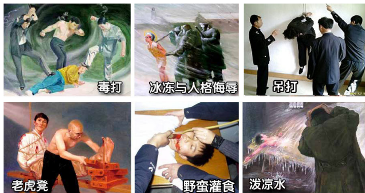
中共对法轮功学员的血腥酷刑

截止2019年7月10日，明慧网突破中共的层层封锁收集和核实的法轮功学员被迫害致死案例有4322件。这远远不是实际发生的迫害致死案例的全部，只是实际发生案例的冰山一角。太多的案例仍然被掩盖，尤其是大量的活摘器官的案例，因为中共焚尸灭迹，仍然没有被揭露出来。在明慧网已查证的案例中，截止到2019年7月10日，有86050人被绑架，28143人被非法劳教，17963人被非法判刑，18838人被绑架关入洗脑班，809人被绑架进精神病院，各种酷刑迫害的总人次518940。这些数据远低于实际发生的迫害案例。◇