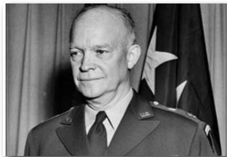
二次大战盟军最高统帅暨美国第34、35任总统艾森豪威尔。

1985年的美国国家祈祷早餐会上，时任总统的里根谈到了艾森豪威尔在1952年总统竞选期间同参议员卡尔森的一次谈话。里根说：“艾森豪威尔向卡尔森参议员吐露，战争期间，他在欧洲指挥盟军时有过一次属灵经历。当时，他感觉到上帝的手在引导他，也感觉到上帝的同在。他还谈到他的朋友们是怎样在登陆之前提供真实的属灵力量的。”◇