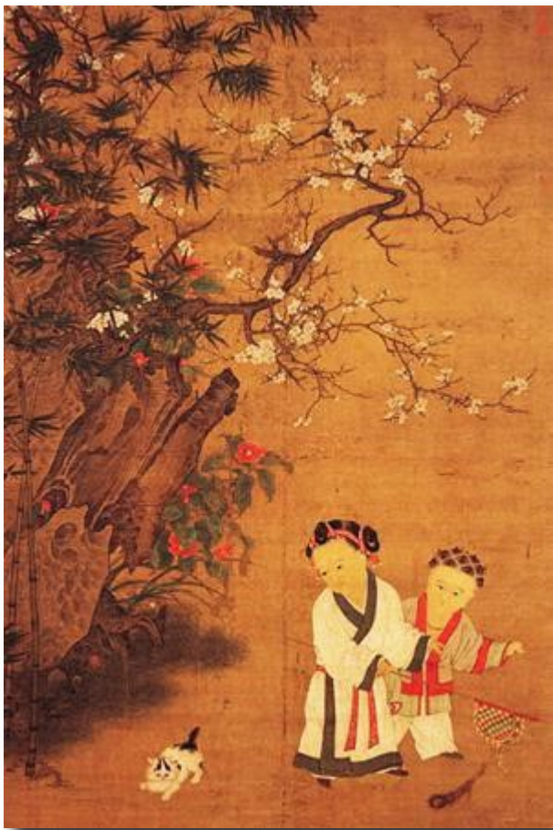
(传)宋 苏汉臣 《冬庭婴戏图》。(台北国立故宫博物院)

在中国绘画中，人物画是一个很主要的画种，不过，以孩童为绘画主题的并不多。把孩童作为主要描绘对象的，一直要到六朝才出现，并且到宋代才真正开始流行。