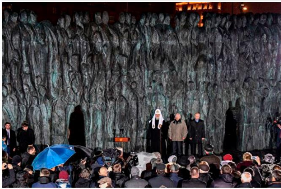
2017年10月30日，俄罗斯总统普京出席“悲伤之墙”揭幕仪式。

纪念前苏联共产党时期受政治迫害者的纪念碑“悲伤之墙”，2017年10月30日在莫斯科落成揭幕，俄总统普京出席了揭幕仪式。这是俄罗斯第一座用青铜雕塑的国家级纪念碑。