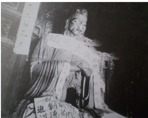
孔子像胸前贴上“头号大坏蛋”的标语。

毛泽东对那个“致敬电”虽未置词，但他说过“我赞成秦始皇，不赞成孔夫子”的话，写过“孔子名高实秕糠”的诗句。“毛主席语录”是红卫兵行动的依据，毛泽东思想给他们掘坟的胆量，这是毫无疑问的。由于戚本禹称赞谭厚兰们“造反造得很好！”掘坟风迅速传遍全国。除了挖不着的，凡史籍中挂了个名字的人，差不多都在1966年被掘了坟。