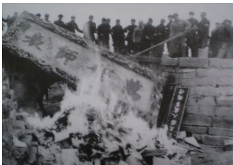
焚烧“万世师表”大匾

1966年11月28、29日连续两天，十万人聚集曲阜召开“彻底捣毁孔家店大会”。大会向毛泽东发去“致敬电”，“汇报一个激动人心的消息”：“敬爱的毛主席：我们造反了！我们造反了！孔老二泥胎被我们拉了出来，‘万世师表’的大匾被我们摘了下来。……孔老二的坟墓被我们铲平了，封建帝王歌功颂德的庙碑被我们砸碎了，孔庙中的泥胎偶像被我们捣毁了……”