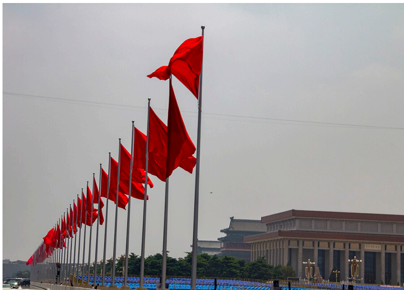
天安門廣場(公有領域)

“中共不等于中国”是一个显而易见但却被华人忽视的一个判断。这一判断指出，中国共产党（CCP）作为一个政治实体，与作为一个国家、民族、文化和人民的整体存在的中国有本质区别。以下是构成此判断的一些基本事实和论述：