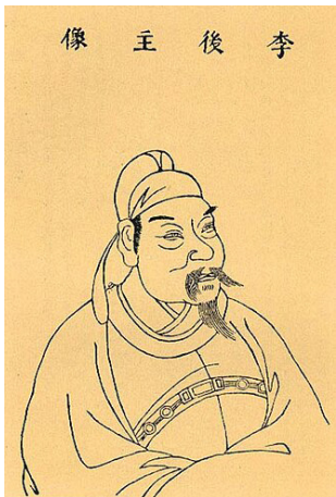
李 后 主 像