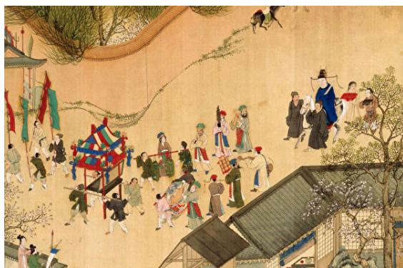
《徐显卿宦迹图·琼林登第》(公有领域)

话音刚落，旁边又有官员问道：“‘相随心改’这个说法，我倒有所耳闻，可‘命由心造’又该如何理解呢？请先生再仔细说一说吧。”