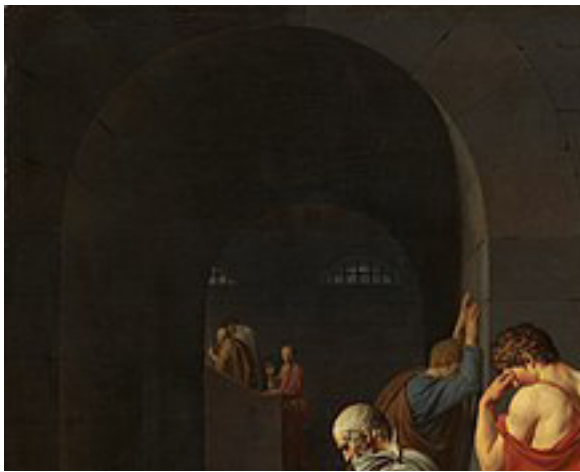
苏格拉底之死。由雅克·路易·戴维所绘（1787年）。（公有领域）

苏格拉底在法庭上为自己所作的申辩词中，以蔑视死亡的浩然之气，一步步、一件件辩驳了法庭和原告强加在自己头上的所谓罪名，陈述了事实的真相，揭露了对方的无知，使法官和原告处于真正的被告席上。他的每一句话都闪烁着智慧的光辉。结果，他被判了死刑。◇