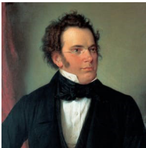
威廉·奥古斯特·里德 (Wilhelm August Rieder, 1796~1880年) 1875年的油画《法蘭茲·舒伯特》。維也納市歷史博物館。

小舒伯特 (Franz Schubert, 弗朗茨·舒伯特) 是奥地利作曲家、古典音乐的巨匠。他身高不足5英尺, 身量瘦小, 长相普通, 而且只活了短短的31年。然而, 从他去世后留下的几封书信中, 人们却能窥见他温柔而善良的灵魂, 没有怨恨, 没有奸猾。