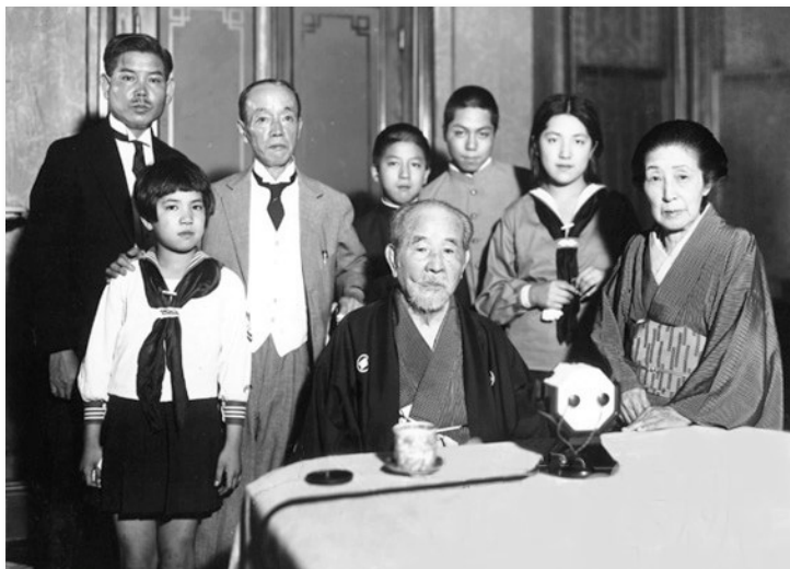
《论语与算盘》作者涩泽荣一及其子孙（1931年9月6日摄）

涩泽荣一（公元1840—1931年）生在日本德川幕府末期，历经明治、大正和昭和时期。虽然他已经作古，声名依然无比响亮。他出生在富裕的农商家庭，父亲除了种植和养蚕之外，还兼作蓝染原料的买卖。