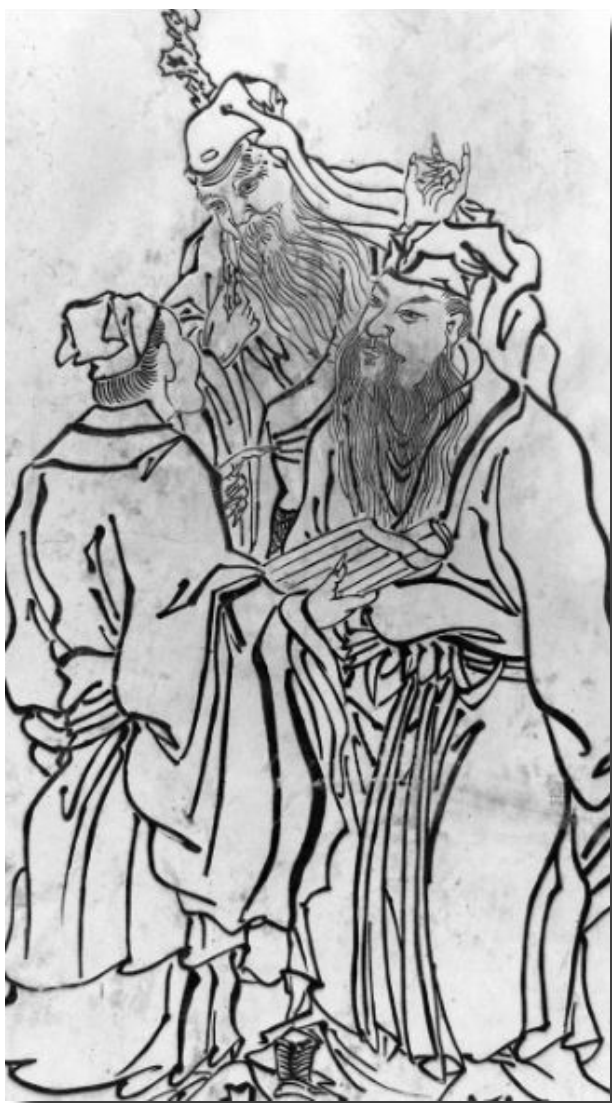
三苏画像

北宋苏辙（1039年3月18日—1112年10月25日），字子由，一字同叔，晚号颍滨遗老，是苏轼（苏东坡）的弟弟，苏洵之子，北宋嘉祐二年（1057年）与其兄苏轼同登进士，曾任户部侍郎、翰林學士、吏部尚書、御史中丞、尚書右丞。苏家父子三人，均在“唐宋八大家”之列，人稱“三苏”。