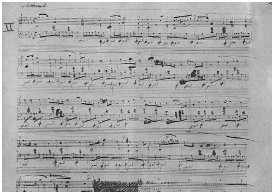
《序曲，第15号》 （Prelude, No.15）， 萧邦手稿。 （公有领域）

萧邦的即兴曲作品中，代表作品是升C小调《幻想即兴曲》，它是在萧邦去世后才发表的，因为萧邦在作曲完后备才发现，作品的中段与波希米亚作曲家伊格纳兹·莫谢莱斯（1794年—1870年）的一首钢琴作品惊人地相似，所以萧邦不愿意将其发表。◇（摘自大纪元网，稍有修改）