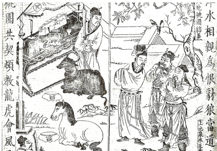
桃园三结义，《三国演义》明刊本插图。 (公有领域)

“话说天下大势，分久必合，合久必分。”撷取百年片段，演绎三家帝王，这是一部开篇便已透露结局的《三国演义》。其中一百二十章回的布局，四百多人的次第登场，七十多万字的鸿篇巨制，作者耗尽笔墨、煞费苦心，究竟要让世人阅读什么？