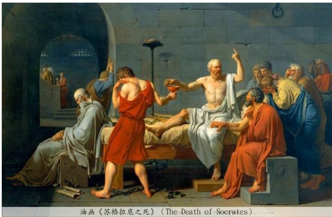
油画《苏格拉底之死》(The Death of Socrates)

古往今来的人们，都有自己的信仰，每个人对信仰的理解也各不相同。有人认为，信仰就像诗篇，偶尔读读，心驰神往；有人觉得，信仰就像星空，可以仰望，但遥不可及。而在真正的信仰者看来，就像肉体需要水的滋养一样，只要活着，灵魂就需要信仰的引领。在生命与信仰之间，如果人必须做出抉择，那么坚定者会毫不犹豫地选择信仰。