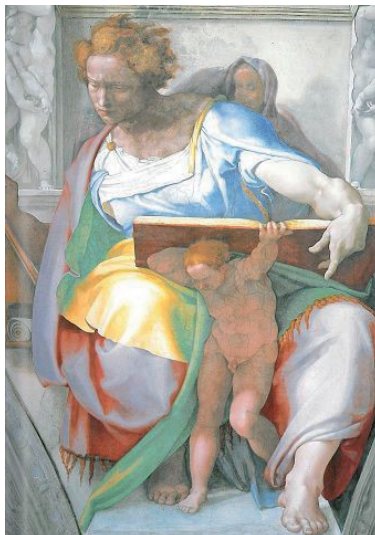
米开朗基罗 《先知丹尼尔》（Prophet Daniel）。注意先知袍子在膝盖上的黄色和旁边的绿色。

文艺复兴前期意大利绘画虽然也有胶绘（Détrempe）、蜡彩（Encaustique）等诸多画种类别，但还是以湿壁画（Fresque）和坦培拉（Tempéra）为主。当时受到技术及材料的时代局限，色料种类很少，艺术家们只能用很有限的少数几种颜色作画。尤其是在湿壁画的绘制中，由于石灰上不能使用对碱性物质敏感以致产生不良化学