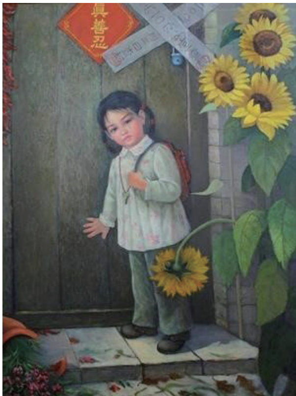
油画：《无家可归》。作者：沈大慈