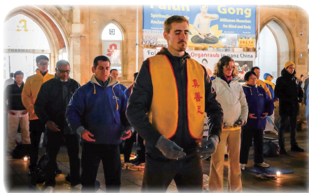
2016年11月4日，来自欧洲不同国家的部份法轮功学员在德国慕尼黑玛丽亚广场（Marienplatz）集体炼功。

艰难的六个月过去了。我眼看着我的职业生涯瓦解。我发展起来的学术合作泡汤了。我无法再好好地教课。我的坎坷不平的爱情也进一步受损。我回到我的家乡。在那里，我的母亲鼓励我尝试“替代疗