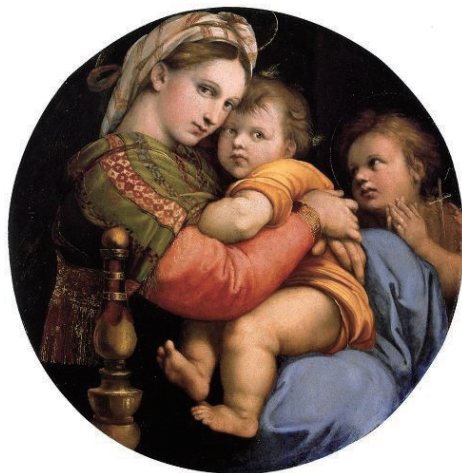
拉斐尔《椅中圣母》（La Vierge à la chaise）

在掌握了Chiaroscuro和Sfumato等技法后，拉斐尔发现这些技法虽然能带来真实的空间感与柔和的渐变，但技法本身基于对明暗塑造过多的依赖，导致画面的深色部分和中间灰调在逐级的过渡下拉长，让画面整体偏暗。拉斐尔在他的艺术生涯中主要绘制的都是表现神和圣徒的作品，而只有明亮的、散发光彩的绘画才更适合于表现神圣题材，这让他想到了类似米开朗基罗一样用较亮的颜色换掉阴暗色彩的办法。但拉斐尔所采用并非早期的Cangiante那种简单置换