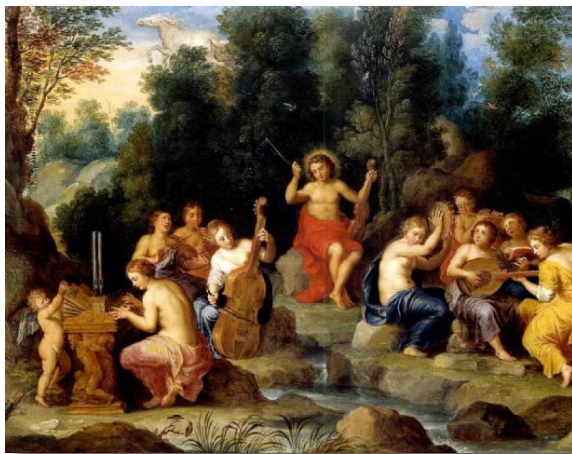
在古希腊神话中缪思是司掌文艺科学九位女神的总称。（维基百科）

著名希腊哲学家如柏拉图、亚里斯多德认为音乐（Music）可以影响一个人的性格气质或品德，也反映出宇宙的和谐之道。一些音乐创作被认为源于太阳神阿波罗、酒神戴奥尼修斯（Dionysus）、希腊信使之神赫密士（Hermes），著名的竖琴手奥费斯（Orpheus）和其他天人。