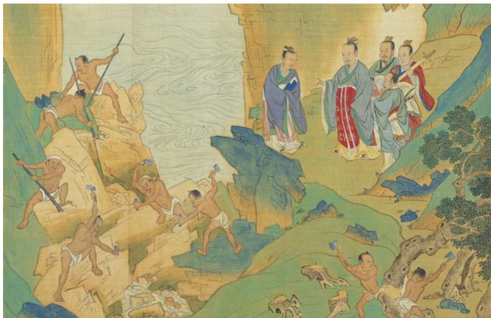
大禹治水，出自明 仇英绘《帝王道统万年图》册页。

史学家章天亮博士曾在演讲中讲到，全世界有许多民族，他们的文化、语言不一样，甚至中间隔着高山、大漠、海洋。不过，他们几乎都有三个共同记忆。