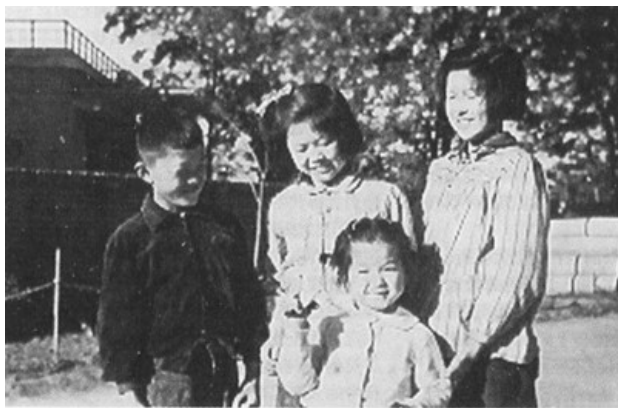
我家的三个孩子和快乐的小洛洛（前）（摄于大连工学院化工系的后院，时间约在1960年，后面的房子是我家。这个院子曾盖起小高炉炼铁。）

萧光琰还天真地幻想，这场运动迟早会结束，便一直默默隐忍着，和妻子、女儿互相扶持、鼓励着熬过了两年。1968年，文革转向“清理阶级队伍”的运动，“工宣队”进驻研究所。这时，就连一向不通政治的萧光琰也预感到局势的恶化。